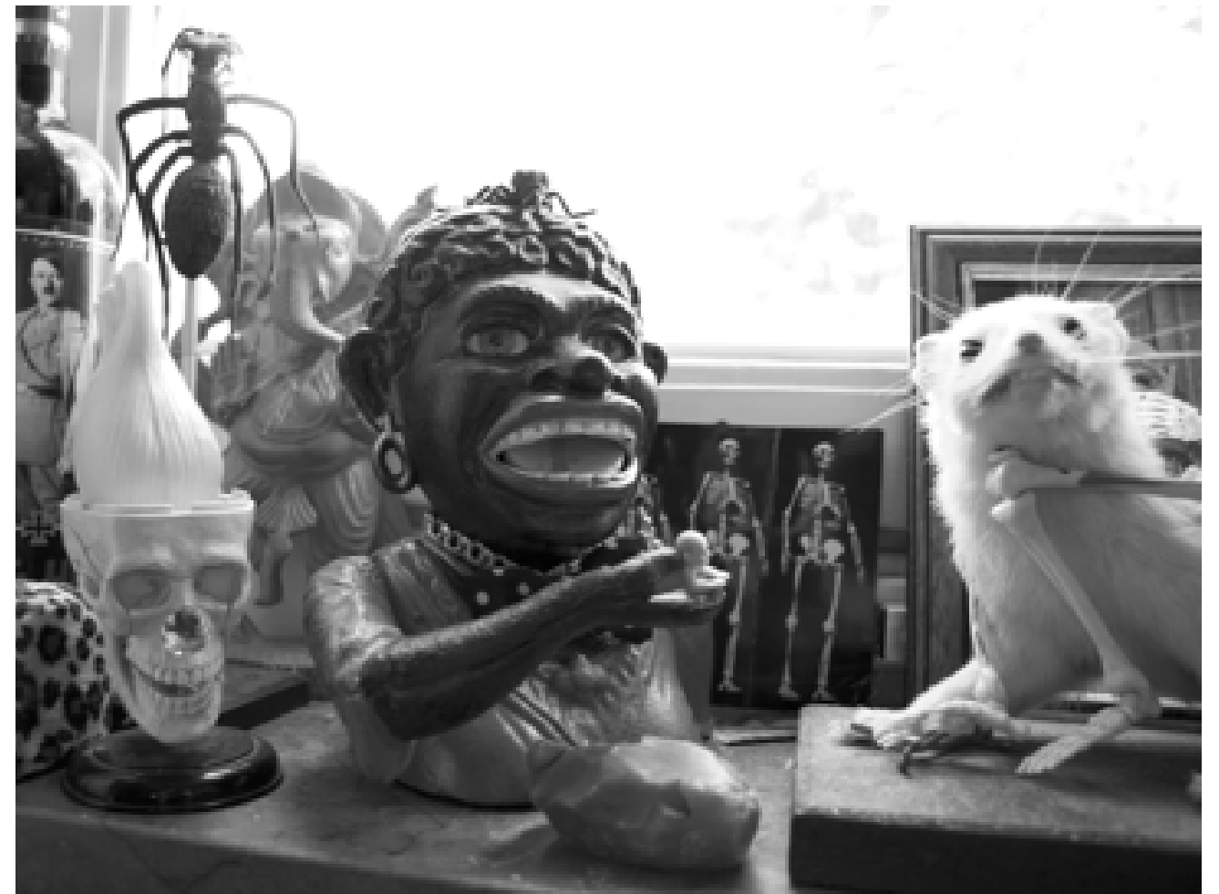
Installation hemma hos Gadd.

Bristen på respekt och förtroende verkade vara ömsesidig. När Gadd stod och målade i ett fame en gång stötte han på några toys. Grabbarna berättade att de hade pratat med några poliser som hade varnat dem för honom.